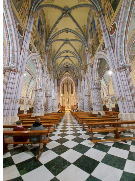
Potes ja kirkko Santanderissa