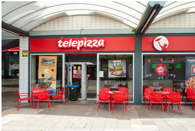
Telepizza ravintola

Aamulla menimme Torrelavegan konservatoriolle. Tutustuimme Cartesin marketteihin ja kiertelimme Torrelavegassa. Ahkeran harjoittelun jälkeen söimme päivällistä Telepizza-ravintolassa, joka oli suuri pettymys joillekin porukasta.