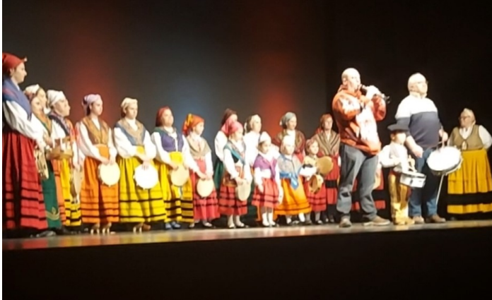
Vioño de Piélagosissa

Esiinnyimme Potesissa, Torrelavegan konservatoriolla, Vioño de Piélagosissa. Kävimme myös paikallisissa jameissa. Joku porukasta uskaltautui lavalle.