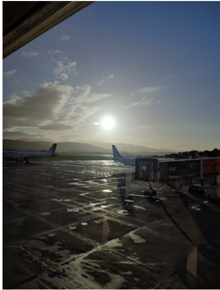
Bilbaon lentokenttä matkustuspäivänä

Matka alkoi Kokkolan juna-asemalta kello viideltä. Matkustimme Helsinkiin ja lensimme sieltä Münchenin kautta Bilbaoon, josta jatkoimme matkaa bussilla kohti Torrelavegaa. Saavuimme myöhään illasta ja asunnon avaimet saatuamme menimme nukkumaan.