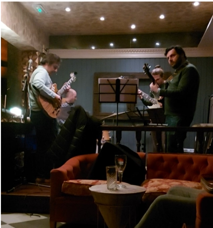
Jamit Oniria e Insomnia baarissa Torrelavegassa

Paluumatka oli pitkä, mutta se sujui hyvin. Ajoimme Bilbaon vuokra-autoilla. Sieltä lensimme Münchenin kautta Helsinkiin. Loppumatka taittui junan kyydissä. Saavuimme Kokkolaan sunnuntaina aamuyöllä.